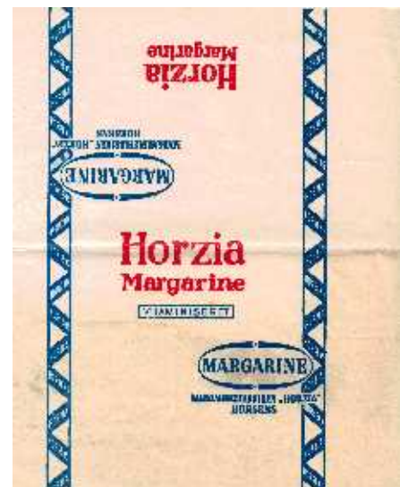
Forskellige typer margarinepapir.