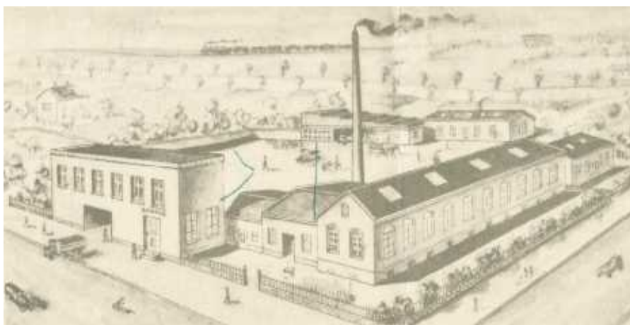
Tegning af fabrikken.

Foruden det store og stigende salg i Horsens og egnene omkring, afsættes store mængder af produktionen også gennem fabrikkens depoter i København, Århus og Vejle.