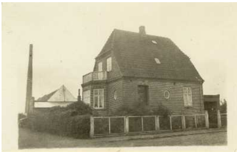
Fabrikken med den høje skorsten ses i baggrunden, her set fra Absalonsgade 20 i 1940.

Men jeg blev stadig i weekenden ved at føre regneskab på Horzia.”